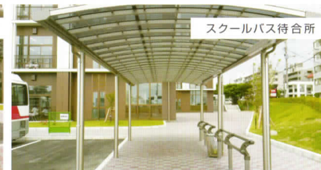
スクールバス待合所