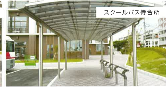
スクールバス待合所