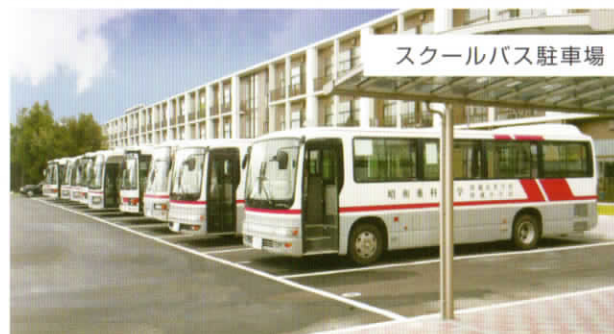
スクールバス駐車場