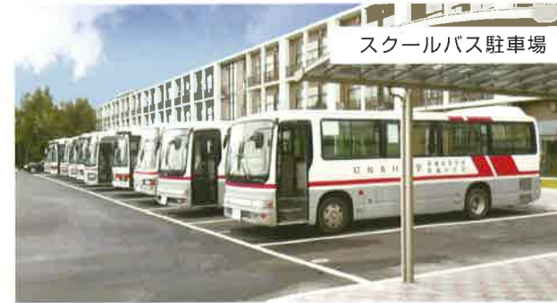
スクールバス駐車場